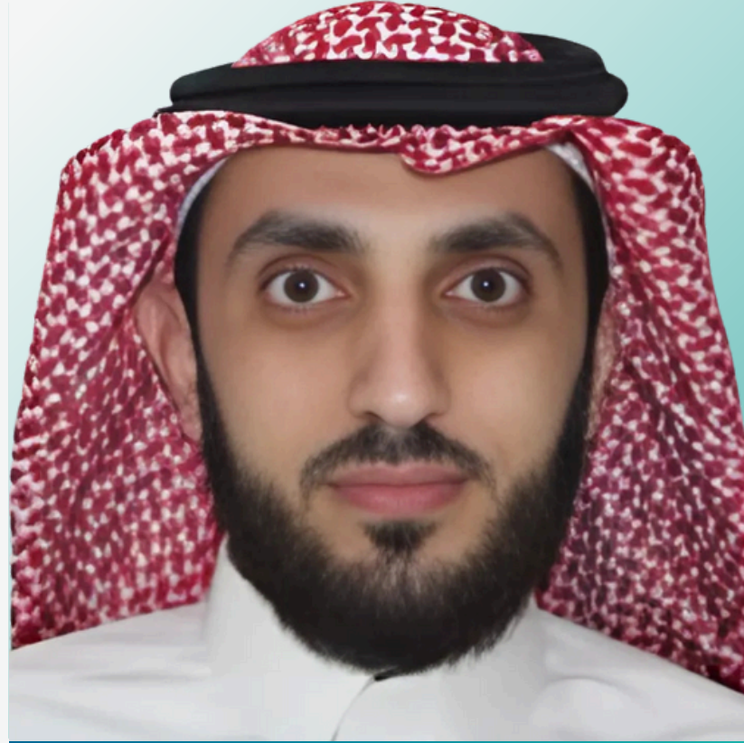
نائب رئيس مجلس الإدارة