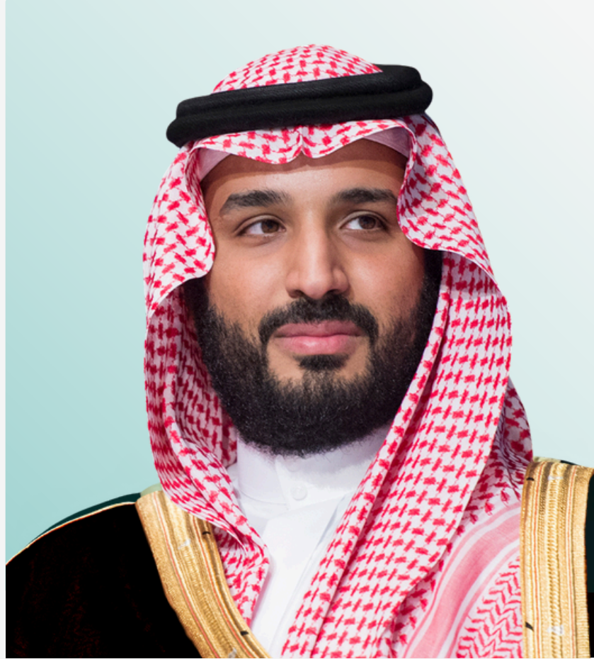
صاحب السمو الملكي

الأمير محمد بن سلمان بن عبدالعزيز آل سعود