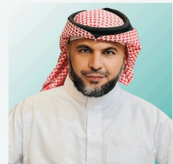
نائب رئيس اللجنة التنفيذية عبدالرحمن بن سليمان الفحام